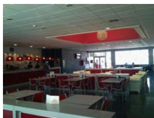
BAR – LOCAL SOCIAL